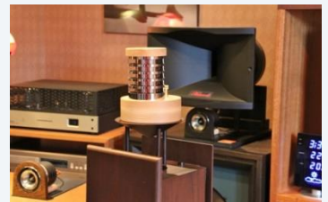
組み合わせ例(ウッドボードスピーカー-HIT-FP1)