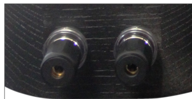
ツイーターの端子部分