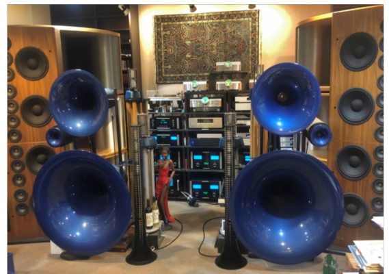
STXXを使用した音響ルーム